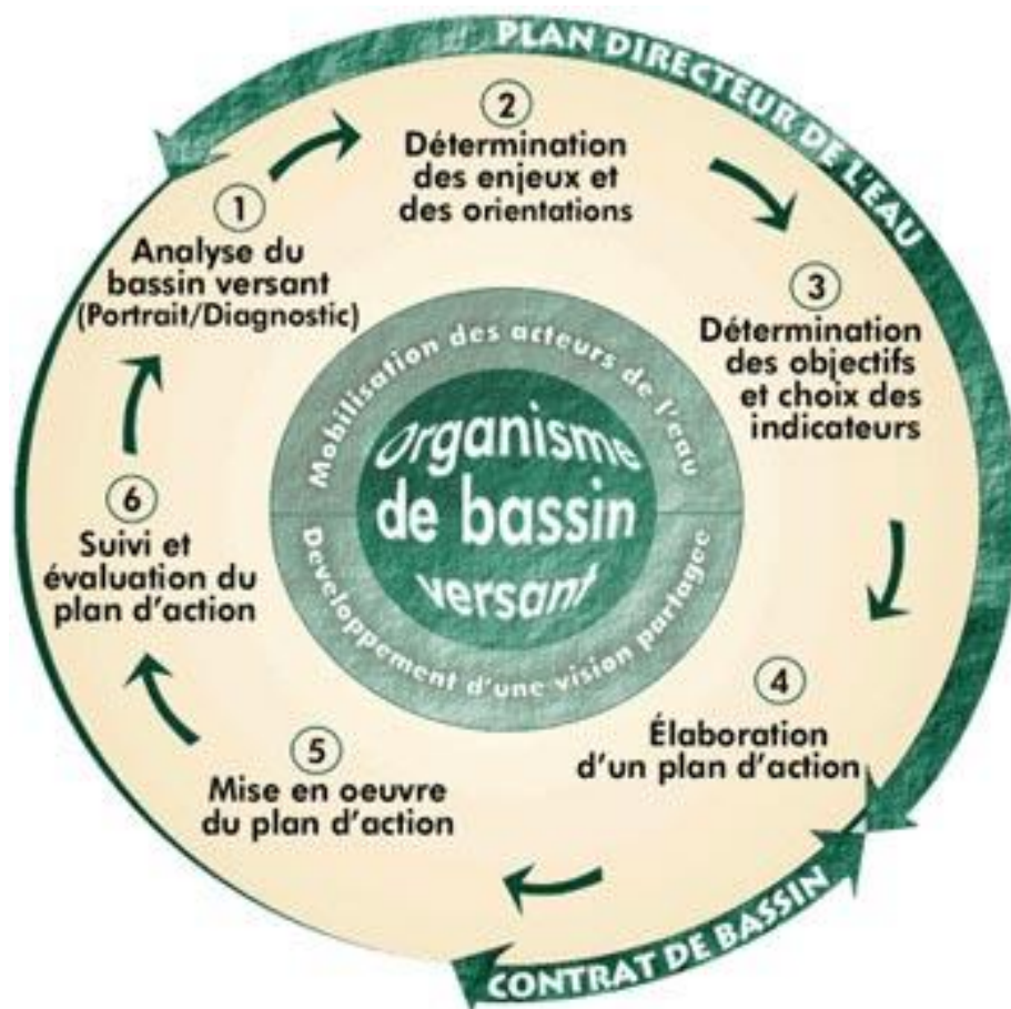
Schéma du cycle de gestion intégrée de l'eau par bassin versant (MDDEP)

Qu'une sécheresse inhabituelle survienne, qu'une nouvelle inondation se produise, qu'une pollution frappe : l'eau nous rappelle qu'elle est nécessairement au cœur des préoccupations de nos sociétés. Le Plan directeur de l'eau (PDE) aide à répondre à ces préoccupations.